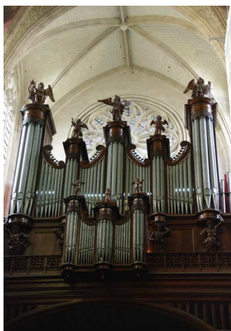
L'orgue Cavaillé Coll d'Orléans

C omme nos orgues salonais sont muets, il faut aller en écouter ailleurs ! Avez-vous profité des concerts de Bouc Bel Air ?